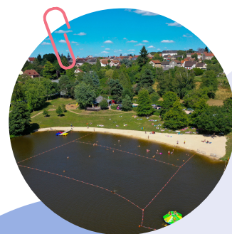
Plan d'eau Châtelus-Malvaleix