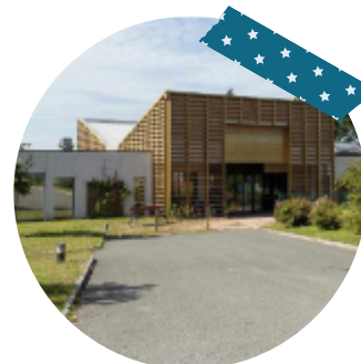
Pôle santé Châtelus-Malvaleix